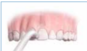
2] Cepillo unipenacho (interespacial)