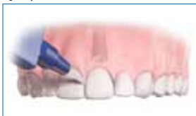
3] Cepillo interproximal