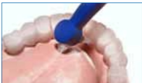
2] Cepillo unipenacho (interespacial)