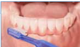
1] Cepillo dental