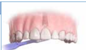
1] Cepillo dental