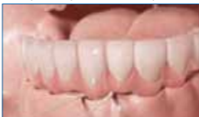
4] Hilo dental