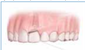
4] Hilo dental