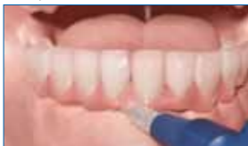
3] Cepillo interproximal